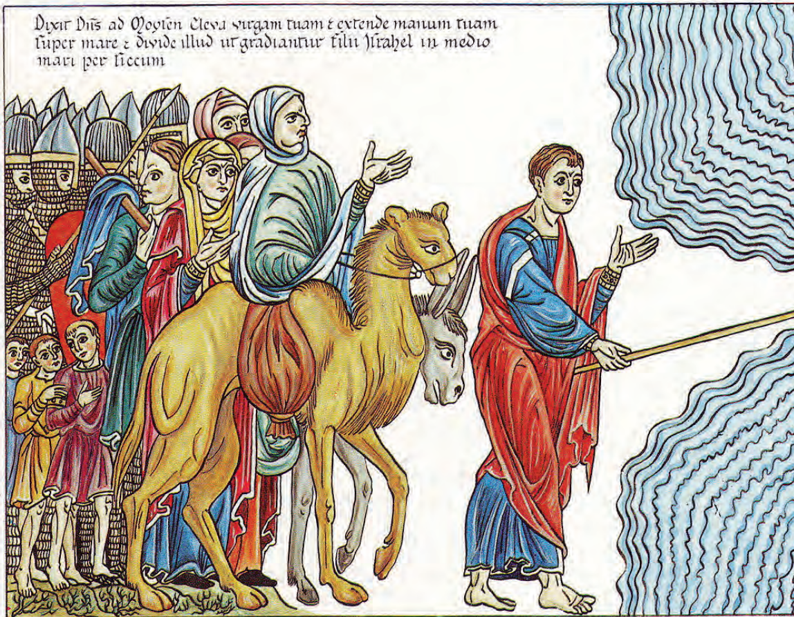
Darstellung aus dem Hortus Deliciarum der Herrad von Landsberg (um 1180)

A ls der Pharao sich näherte, blickten die Israeliten auf und sahen plötzlich die Ägypter von hinten anrücken. Da erschreckten sie sehr und schrien zum Herrn. Zu Mose sagten sie: Gab es denn keine Gräber in Ägypten, dass du uns zum Sterben in die Wüste holst? Was hast du uns da angetan? Warum hast du uns aus Ägypten herausgeführt? Haben wir dir in Ägypten nicht gleich gesagt: Lass uns in Ruhe! Wir wollen Sklaven der