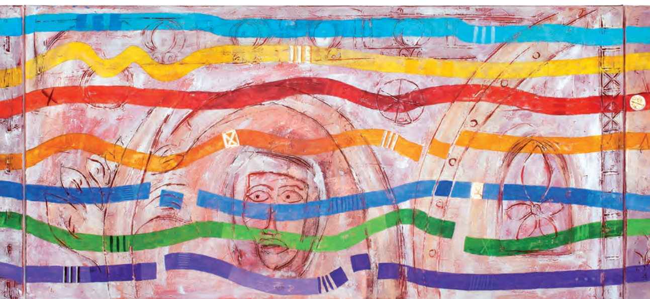
© Michael Blum, Lebenslinien auf dem Weg zum Licht

Das Mädchen steht am Beckenrand. Toll sieht sie aus in ihrem neuen Badeoutfit. Mit Anlauf und unter viel Lachen springt sie hinein ins Wasser, mitten unter die Freunde. Wettschwimmen, Ball spielen, tauchen – alles macht so viel Spaß! Freigar nicht auf sich selbst achtend, fröhlich, ganz in ihrem Element ist sie.