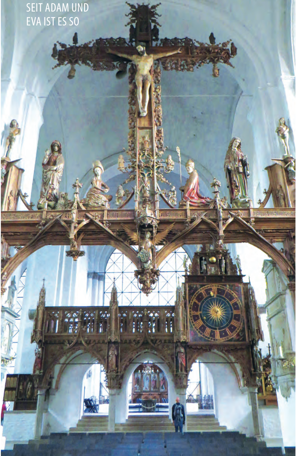
Triumphkreuz von Bernt Notke von 1477 im Lübecker Dom – Foto: 2021@ Bernard Blanc on flickr.com